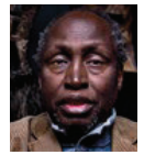
Ngugi wa Thiong'o