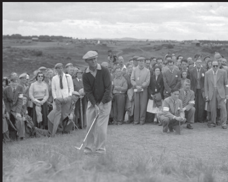
Golflegendären Ben Hogan fick låna ut sitt namn åt hjälten i en rekordlång boksvit.