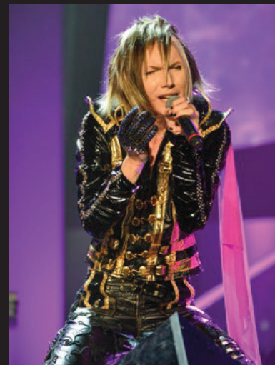
Författaren skrev poplåtar i lag med artisten Yohios farfar.