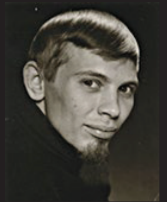
Rekordförfattaren som ung popbandsmanager.