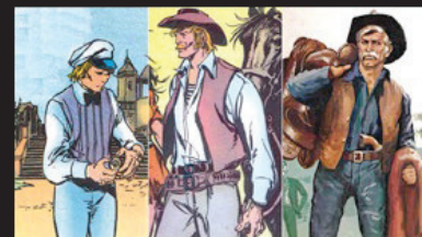
Tre faser i den toktuffe romanheroen Ben Hogans liv.